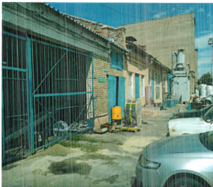
Строй цех с кадастровым номером 61:44:0032112:90